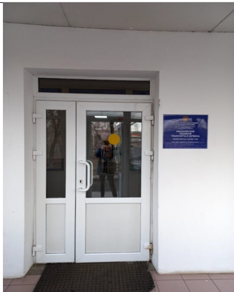
Фото 5 Вход в здание из тамбура с вывеской со шрифтом Брайля для лиц с нарушениями зрения, слуха, умственного развития (вид изнутри)