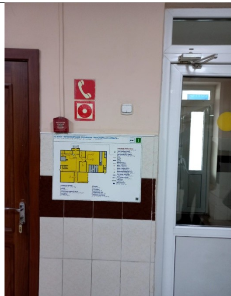
Фото 6 Наличие мнемосхемы со шрифтом Брайля с правой стороны при входе для лиц с нарушениями зрения.