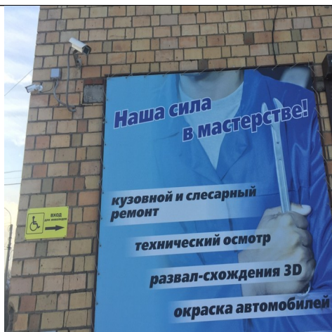
Фото 1 Указатель на вход для людей с ОВЗ

В настоящее время в техникуме созданы условия для безбарьерного посещения здания всеми категориями инвалидов, в том числе инвалидами – колясочниками, инвалидами с нарушениями опорно-двигательного аппарата, с нарушением зрения. Данные категории граждан имеют возможность на первом этаже учебного корпуса познакомиться с информацией о реализуемых основных программах СПО, программах профессионального обучения, программах ДПО, об условиях поступления на обучение. Для маломобильных граждан имеется отдельный вход, позволяющий передвигаться при помощи использования специальных средств передвижения.