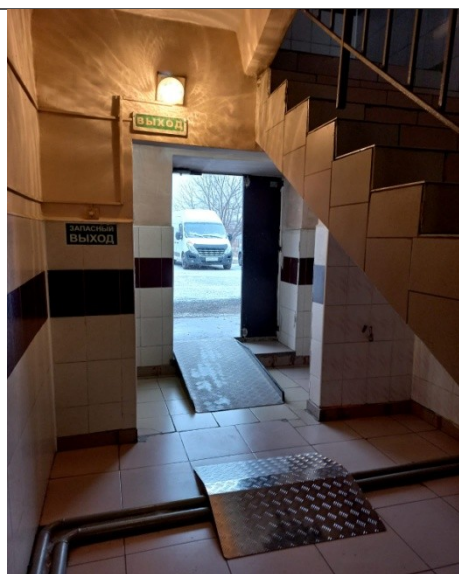
Фото 3 Вход в здание для маломобильных граждан с наличием пандусов (вид изнутри)