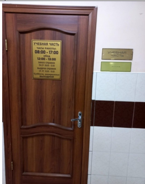
Фото 7 Учебная часть расположена в холле на первом этаже. Здесь можно получить ответы на возникающие вопросы.