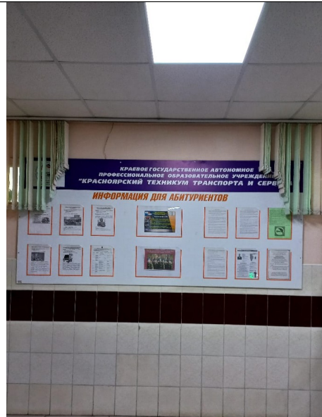
Фото 8 Информационный стенд в холле на первом этаже о программах, реализуемых в техникуме, правилах поступления на обучение