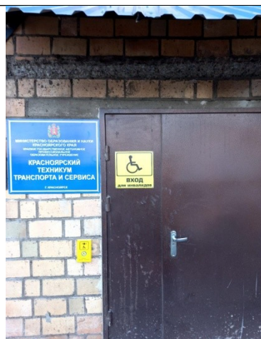
Фото 2. Входная дверь для маломобильных граждан (вид снаружи)