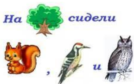
Рис. 2. Перед одиночным союзом И, соединяющим однородные члены предложения, запятая не ставится.

и первыми лучами , скрасило эту унылую и неприглядную равнину.