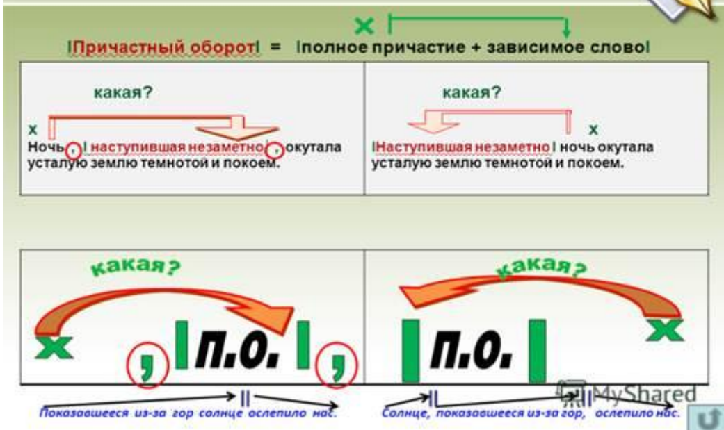
Рис. 1. Таблица

Если причастный оборот стоит после определяемого слова, то он выделяется интонацией, а на письме - запятыми с двух сторон.