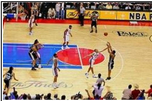
Бросок из-за трёхочковой линии