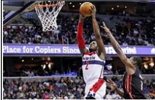
Бросок со средней или близкой дистанции